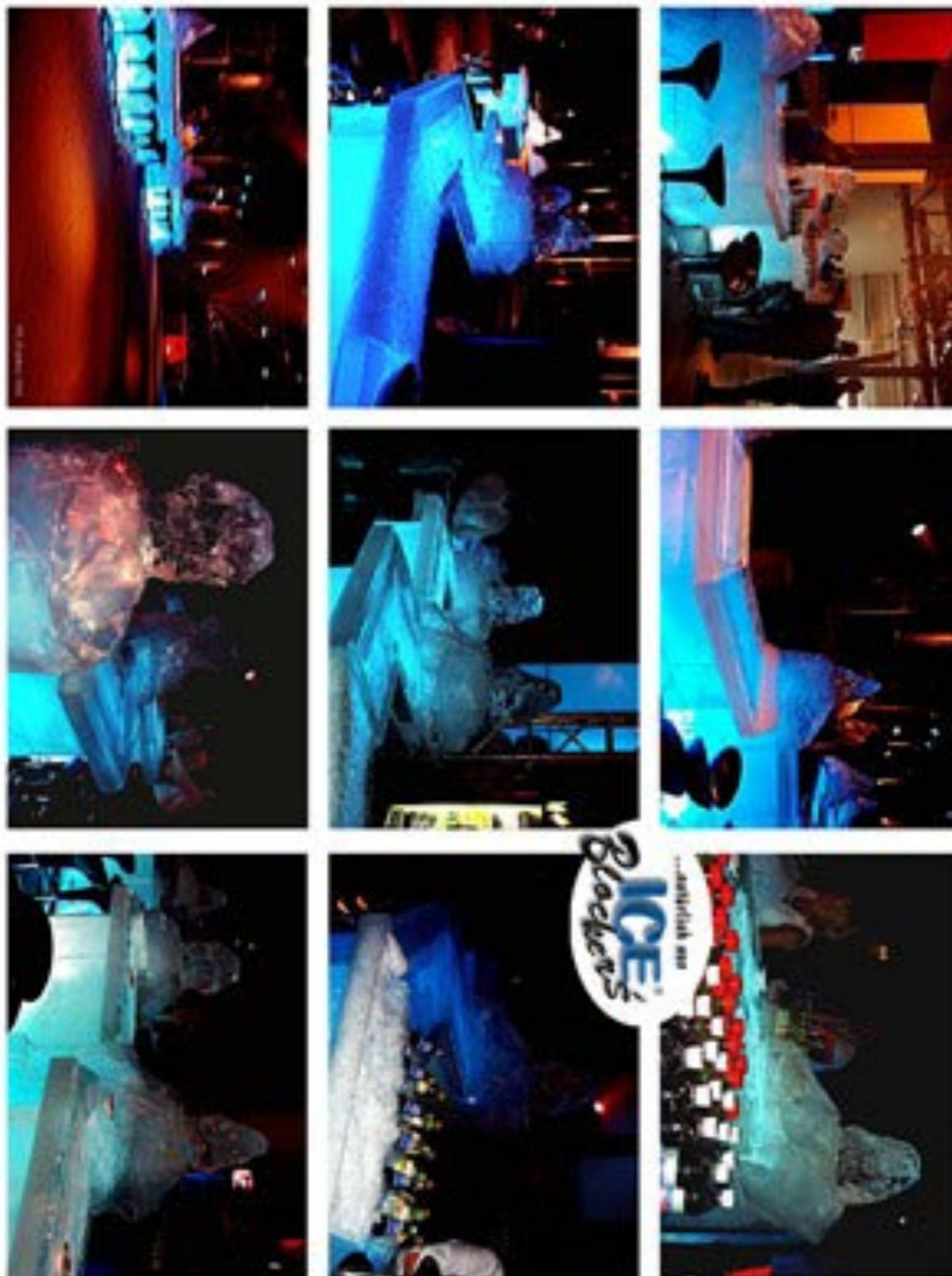
ICE-BlockenS ® ist ein registriertes Markenzeichen der Fa. WINKLER & RICHTER. NIEDERLASSUNG: Tabbertstraße 14 - 15 • 12459 Berlin • BestellNr. 030- 53781090, Fax 030- 53218758