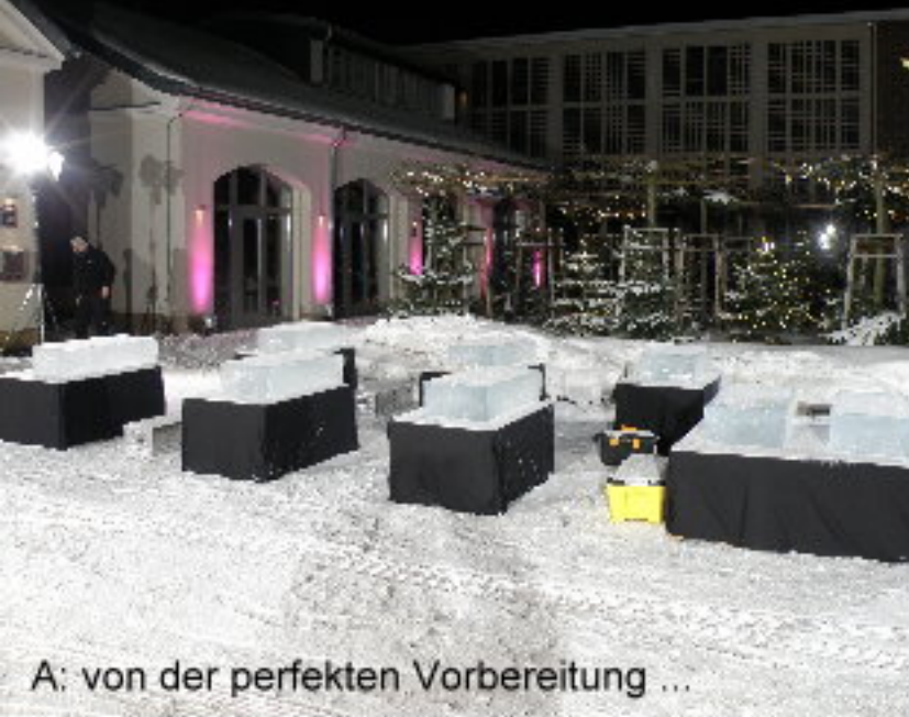
A: von der perfekten Vorbereitung ...

www. iceblockers.de cooldrinks@ iceblockers.de Tel.: 030/53781090