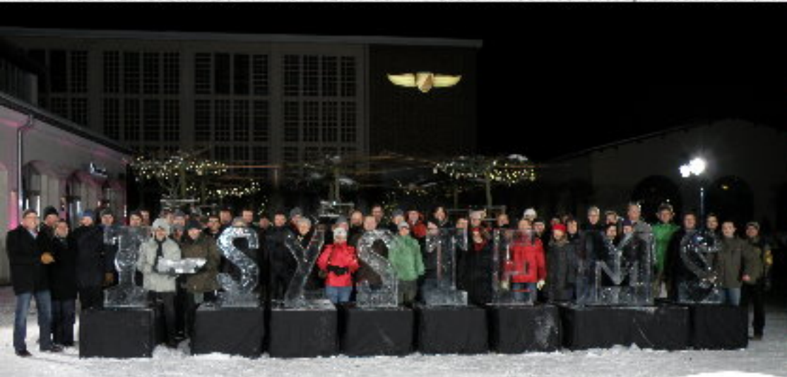
E: zum tollen Teamergebnis !