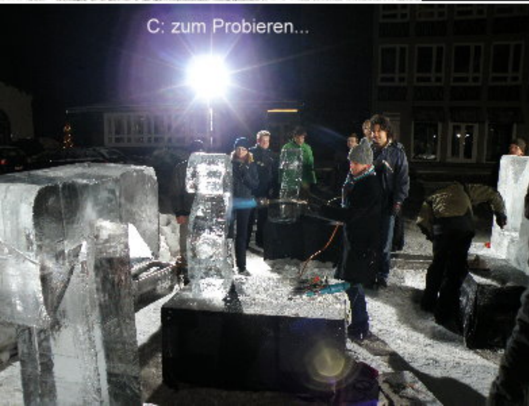
C: zum Probieren...