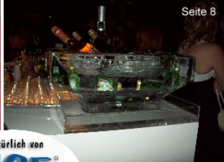
neue Eisschalen mit Randeinfrierungen