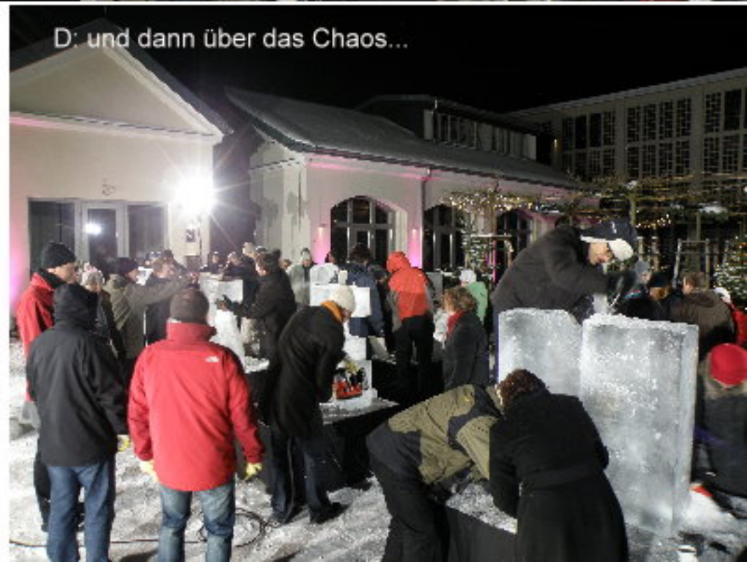
D: und dann über das Chaos...