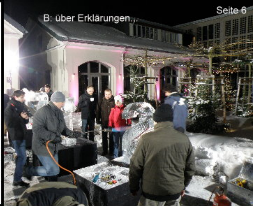
B: über Erklärungen...

www. iceblockers.de cooldrinks@ iceblockers.de Tel.: 030/53781090